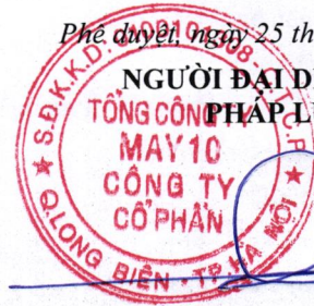
Thân Đức Việt